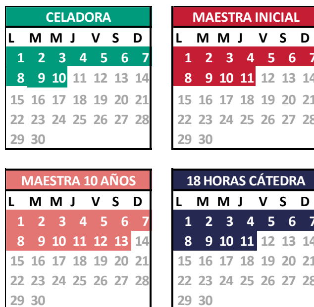
Gráfico 3: Cantidad de días cubiertos por los salarios